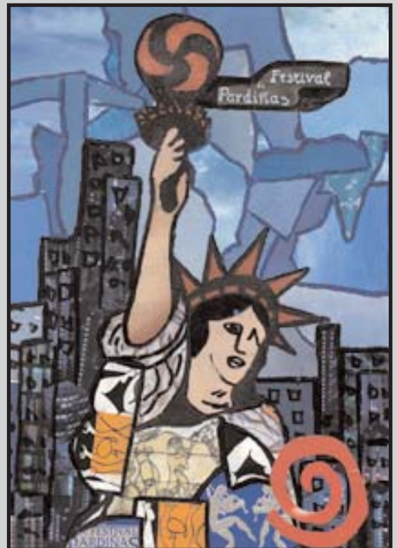
Debuxo de Yago Quijada López

Ó principio non sabía como falarlle. Achegarse a unha moza é unha situación que realmente logra poñerte nervioso, e sobre todo a unha rapaza coma Layla, que viña de pasalo tan mal: o seu pai estaba no cárcere por un delicto que contiña bastante sangue inocente, a súa nai estaba morrendo dun cancro e a súa irmá maior decidira que o seu profesor de matemáticas estaba fisicamente mellor có seu mozo, e fugárase con el. Unha vida divertida, ¿verdade? Por iso non sabías que dicirlle. E como Alaska e os Pegamoides e os cómics non lle gustaban, decidín preguntarlle a hora, simplemente decidín preguntarlle a hora. E aínda hoxe me